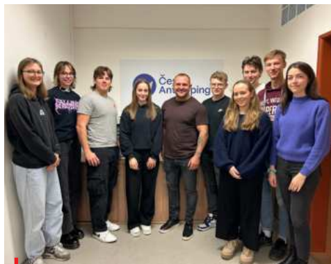
Studenti Managementu sportu FTVS Univerzity Karlovy na praxi v Českém Antidopingu.

Účast na akcích, jako je Olympiáda dětí a mládeže, nám umožňuje mluvit o fair play přímo tam, kde se rodí budoucí šampioni. Vzdělávání nejde dělat od stolu - chceme naslouchat, diskutovat a inspirovat se. Proto jsme vyrazili se vzdělávacím stánkem na Olympiádu dětí a mládeže - tentokrát do Haly Polárka ve Frýdku-Místku, kde jsme předávali antidopingové znalosti účastníkům i návštěvníkům ODM.