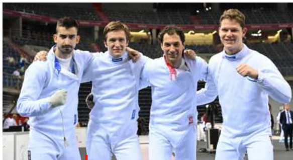
Bronzoví kordisté z OH 2024

Sportovní psycholog tak může sportovcům pomáhat s překonáním nějaké aktuální zátěže, která zasahuje i do sportovního výkonu (např. překonání nepříjemného zranění, zkuškové období, přechod do nového týmu), stejně tak může být nápomocen při dosahování krátkodobých/aktuálních cílů, např. v podobě zvládnutí nominálních závodů aj. Se sportovci lze ale pracovat také dlouhodobě, obvykle se záměrem zařazení systematické psychologické přípravy k optimalizaci výkonu a naplnění potenciálu, nebo prevenci předčasného ukončení sportovní kariéry. Možností je také práce s celým sportovním týmem, což s sebou nese větší nároky na čas psychologa a spolupráci s trenérem/y.