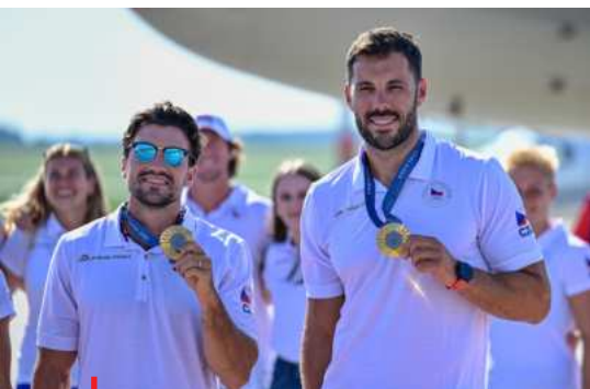
Zlatí medailisté z Paříže Josef Dostál (vpravo) a Martin Fuksa.

Poprvé v historii ankety byli ve finálovém výběru zástupci pouhých čtyř sportů. V desítku figurují tři tenisté a hokejisté a dva rychlostní kanoisté a atleti. Barbora Krejčíková již potřetí obsadila druhé místo. Kromě ní byli v desítku nejlepších také tři hokejoví mistři světa a dva atleti - bronzová olympijská medailistka Nikola Ogrodníková a mistr Evropy Jakub Vadlejch.