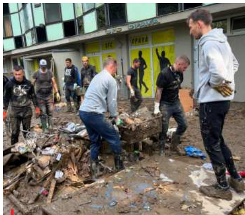
Největší škody po ničivých záříjových povodních utrpěl fotbalový stadion Slezského FK Opava.