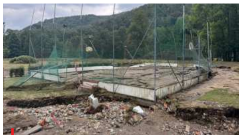
Část zničeného sportovního areálu v Hanušovicích.

Většina poškozeného majetku byla pojištěna, ale majitelé nahlásili škody i na objektech, které jsou nepojistitelné. Zmapování škod bylo