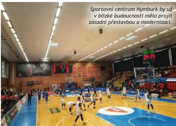
Sportovní centrum Nymburk by už v blízké budoucnosti mělo projít zásadní přestavbou a modernizací.

Důležitým bodem jednání byla také obšírná diskuse k Etickému kodexu sportu a Etickému kodexu správného trenéra, který předložila Národní sportovní agentura ke konzultaci a připomínkám střešním sportovním organizacím včetně České unie sportu. ČUS tuto iniciativu vítá a domnívá se, že myšlenky a úvahy, které obsahují, by byly nepochybně přínosné pro spor-